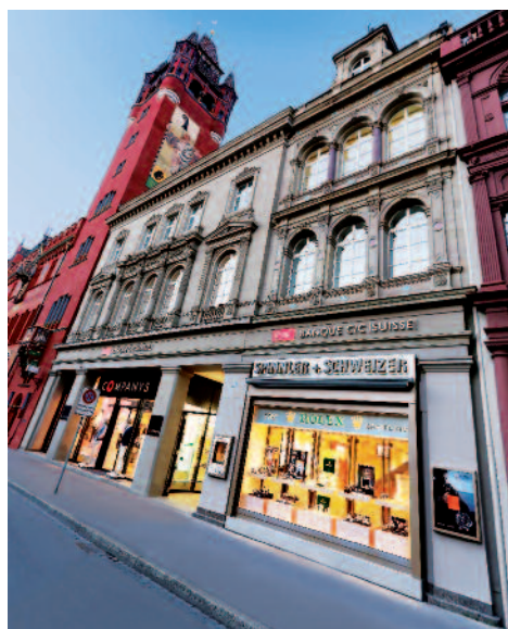
Legendum ipsum dolor legendum. Bla laberum.

Rolex, IWC, Breitling, Chopard, Hublot, Longines, TAG Heuer, Oris, Tudor, Tissot