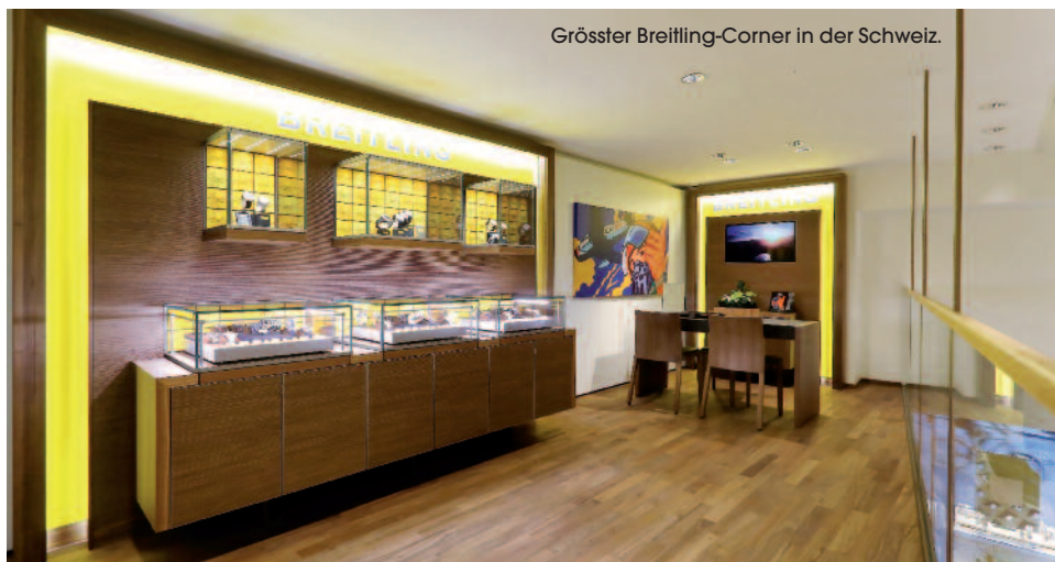
Grösster Breitling-Corner in der Schweiz.